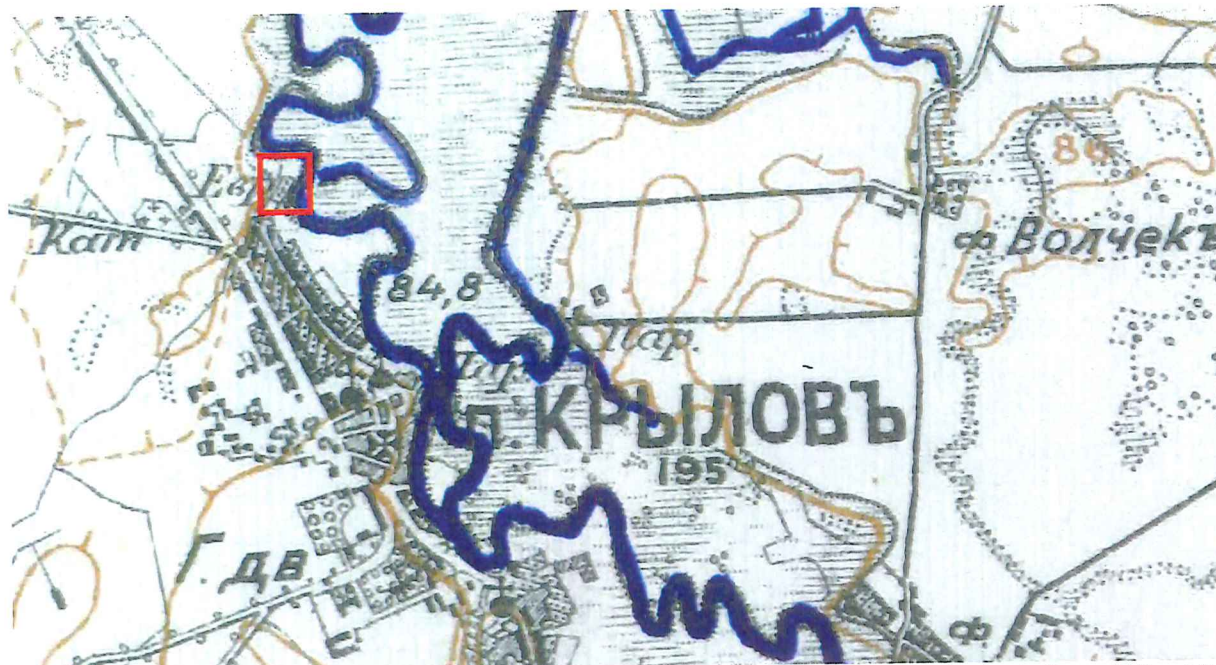
Nowaja topograficeskaja karta Zapadnoj Rossii, 1:84 000 (zw. dwuwiorstówka), ark. Lublinskaja i wołyńska gub., władimir wołyn., hrubieszowski i kowelskij ujezdy,, XXIX-16, 1915. Lokalizacja cmentarza zaznaczona kolorem czerwonym.