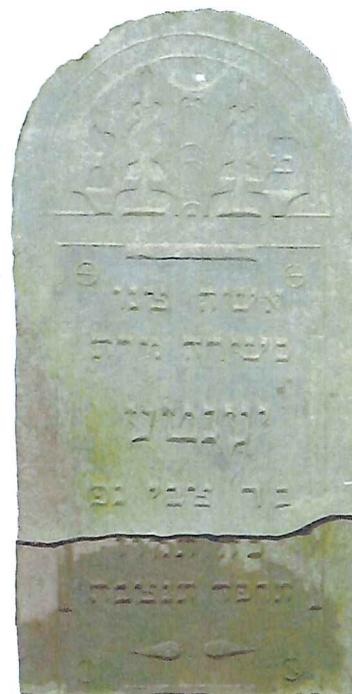
Jenta bat Cwi, zm. 25 tamuz 5684 r., tj. 27 lipca 1924.