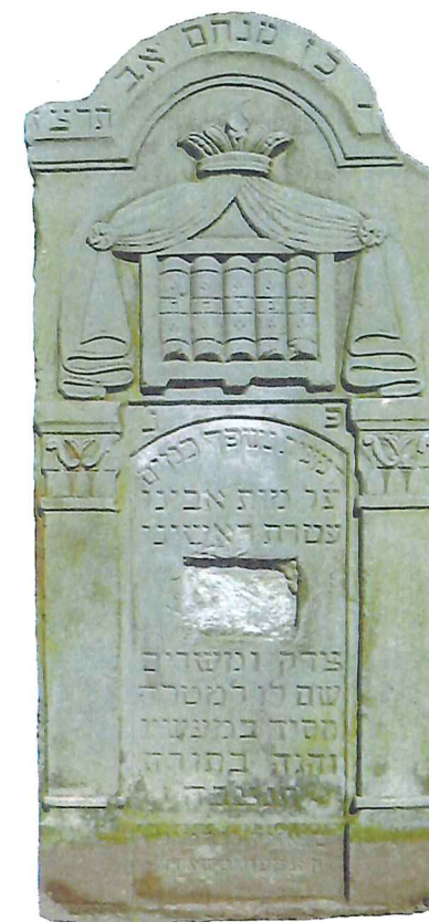
NN, mężczyzna, zm. 27 aw 5697, tj. 4 sierpnia 1937 r..