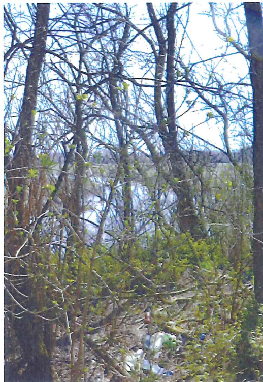
Cmentarz żydowski w Kryłowie, zarośla i część wysypiska śmieci w północno-wschodniej części nekropolii fot. M. Tarajko, 2021.