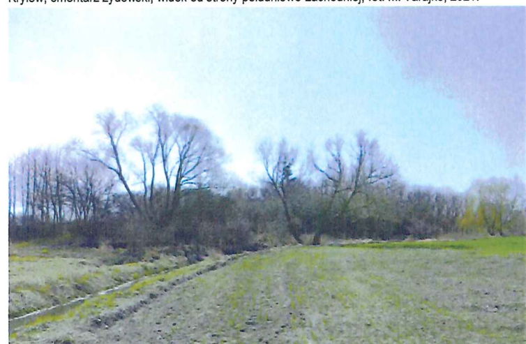
Kryłów, cmentarz żydowski, widok od strony północnej, fot. M. Tarajko, 2021.

4. Adres (ulica, nr posesji) ul. Nadbużna