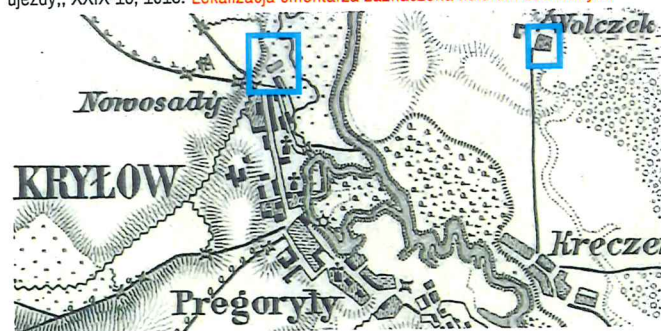
Spezialkarte der österreichisch-ungarischen Monarchie [powiększenie niemieckiej mapy 1:100 000 z 1914 r.], 1:75 000, Waręż 3 XXX (3772), 1878 – brak oznakowania cmentarza przy jednoczesnym wskazaniu nekropolii w Wolczku. Lokalizacja cmentarzy w obu miejscowościach zaznaczona kolorem niebieskim.

Analizowane zasoby kartograficzne wskazują, że cmentarz miał kształt zbliżony do prostokąta. Obecny kształt działki nie pokrywa się z kształtem cmentarza. Granica wschodnia w części północnej przebiegała najprawdopodobniej po linii muru oporowego, a w południowej – po linii okopu. Dokładna weryfikacja granic cmentarza wymaga przeprowadzenia nieinwazyjnych badań terenu.