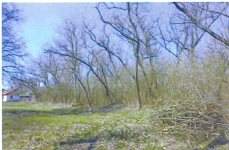
Cmentarz żydowski w Kryłowie, widok od północnego wschodu. na południowy odcinek granicy wschodniej, fot. M. Tarajko, 2021.