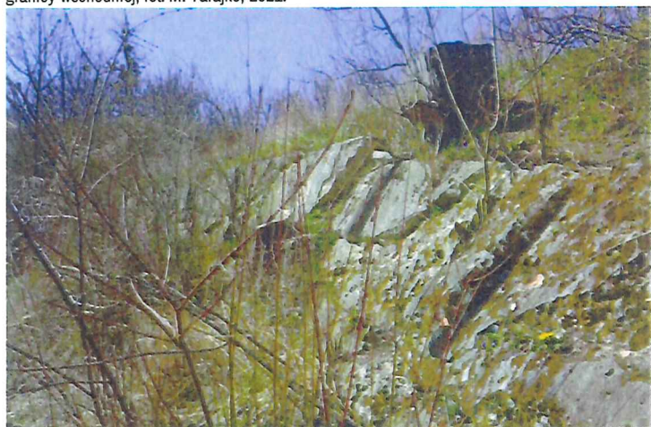
Cmentarz żydowski w Kryłowie, widok na umocnienia na północnym odcinku wschodniej granicy nekropolii (od strony rzeki) fot. M. Tarajko, 2021.