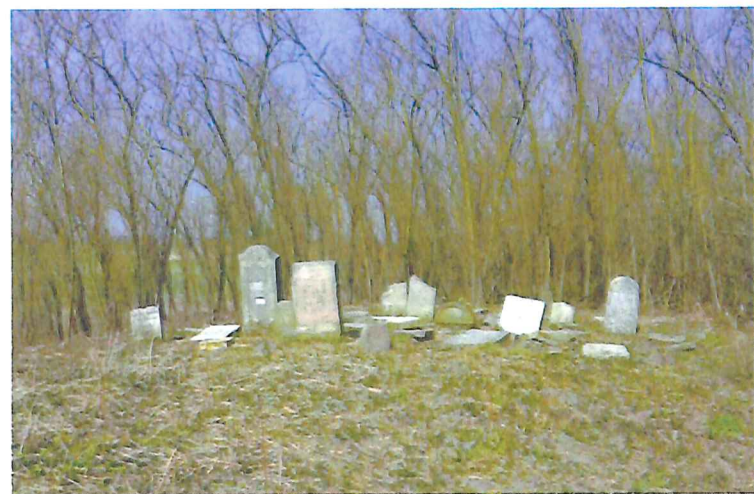
Kryłów, cmentarz żydowski, widok od strony południowo-zachodniej, fot. M. Tarajko, 2021.