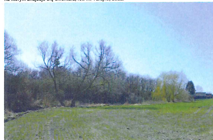
Cmentarz żydowski w Kryłowie, widok od północy na granicę północno-zachodnią, fot. M. Tarajko, 2021.

Opracowanie załącznika: Monika Tarajko, 14.10.2021 (data i podpis)