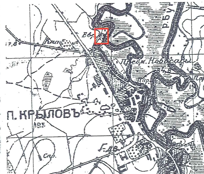
West. Osteuropa, Niemieckie mapy zaboru rosyjskiego, I WS (1914–1919), 1:25 000, ark. Gruppe Bresst Litowssk XXIX 16-A (XXIX 16-A), Kart. Abt. des stell. Generalstabes der Armees 1915. Lokalizacja cmentarza zaznaczona kolorem czerwonym.