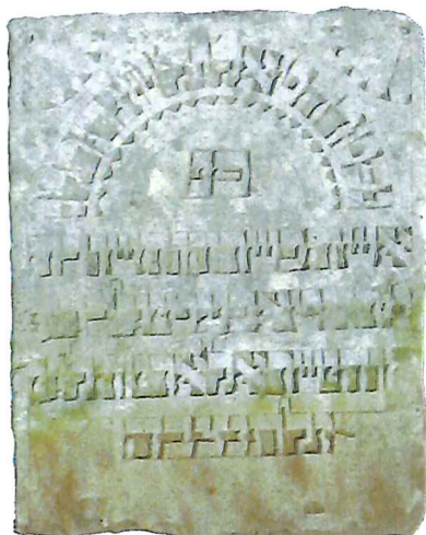
Taba Etel bat Jisrael Arje ha-Lewi, zm. 9 elul 5636, tj. 29 sierpnia 1876 r..