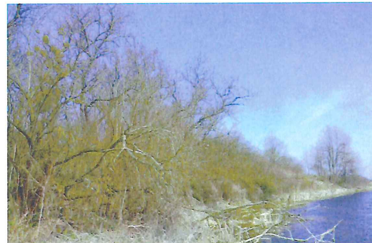
Cmentarz żydowski w Kryłowie, widok od południowego-wschodu na brzeg Bugu i wzniesienie, na którym znajduje się cmentarz, fot. M. Tarajko, 2021.